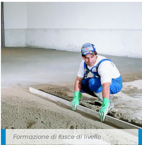
Formazione di fasce di livello