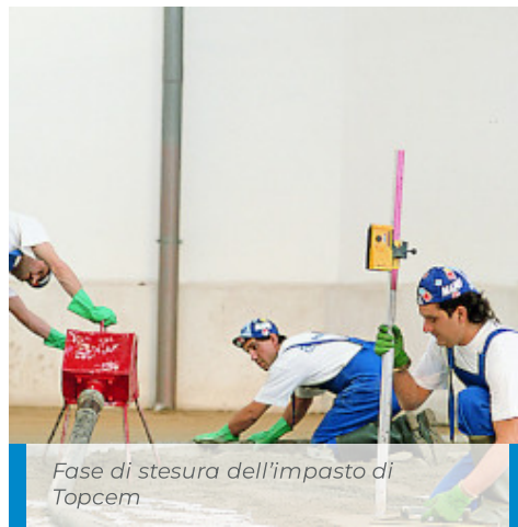
Fase di stesura dell'impasto di Topcem