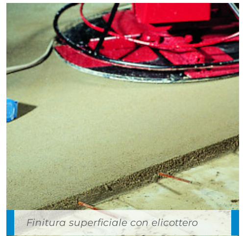
Finitura superficiale con elicottero