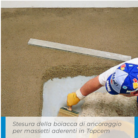
Stesura della boiacca di ancoraggio per massetti aderenti in Topcem