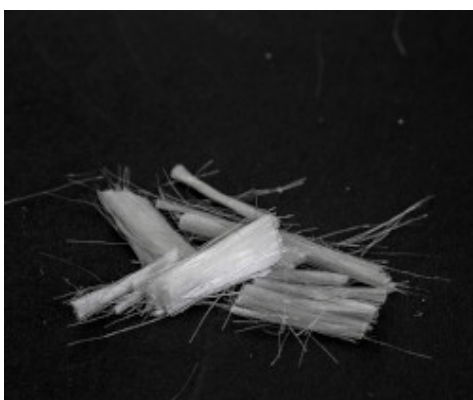
Microfibre mono filamento Mapefibre AT 12/18 FP