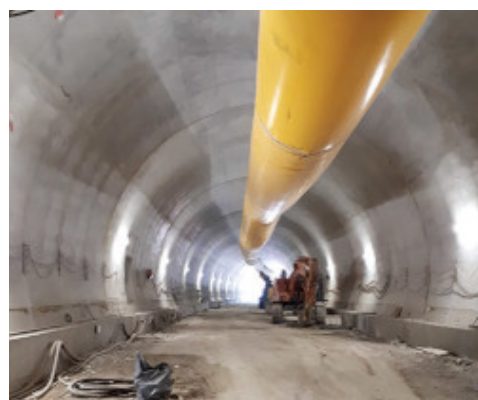
Esempio di rivestimento definitivo di una galleria a scavo tradizionale