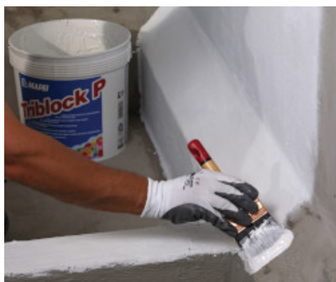
Applicazione a pennello di Triblock P sul supporto umido

La superficie verniciata con Mapecoat DW 25 è lavabile con acqua e detersivi (eseguire una prova preliminare data la molteplicità dei prodotti in commercio).