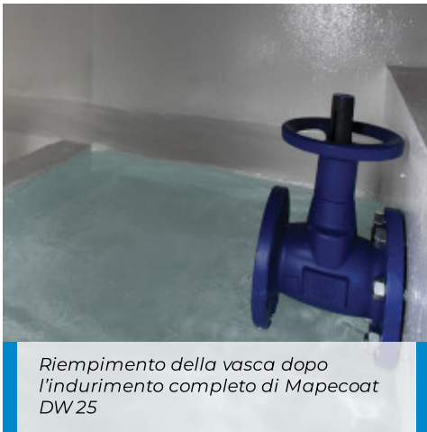
Riempimento della vasca dopo l'indurimento completo di Mapecoat DW 25