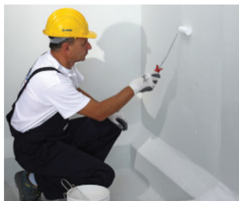
Applicazione a rullo di Mapecoat DW 25