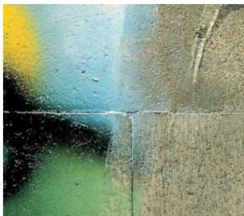
Lavaggio con acqua corrente