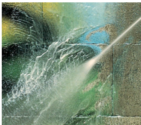
Lavaggio con acqua in pressione