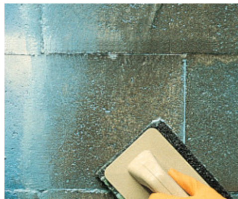
Pulizia con feltro abrasivo