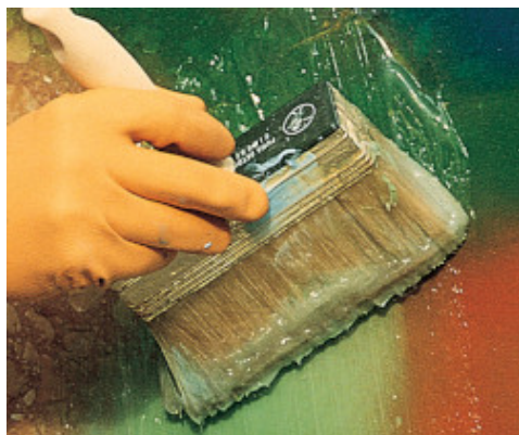
Applicazione di WallGard Graffiti Remover Gel a pennello

Risciacquare bene con acqua la superficie trattata.