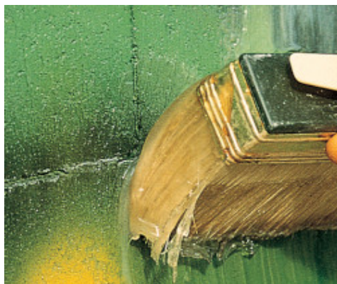
Applicazione di WallGard Graffiti Remover Gel a pennello