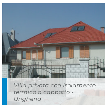
Villa privata con isolamento termico a cappotto - Ungheria