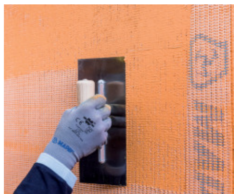
Inserimento di Mapetherm Net nello strato fresco di Mapetherm Flex RP