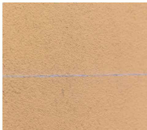
Vecchio cappotto fessurato

Mapetherm Flex RP asciuga grazie al processo fisico di evaporazione dell'acqua; in condizione ambientali normali il prodotto raggiunge la completa essiccazione in 10 giorni circa. In caso di pioggia o elevata umidità i normali tempi di asciugatura si allungano; si raccomanda di prevedere adeguate misure protettive (es. teli antipioggia) per evitare inestetismi in facciata.