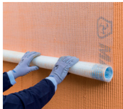
Posizionamento di Mapetherm Net