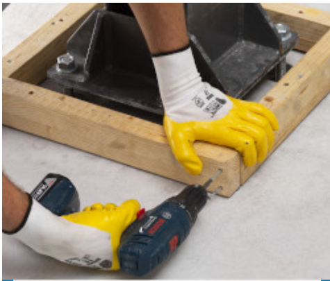
Montaggio della cassetta prima del getto