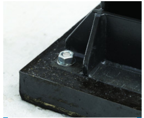
Particolare del riempimento sotto piastra