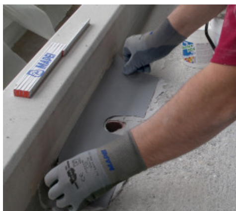
Posa di bandella elastica in Hypalon