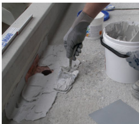
Rasatura successiva con Adesilex PG4