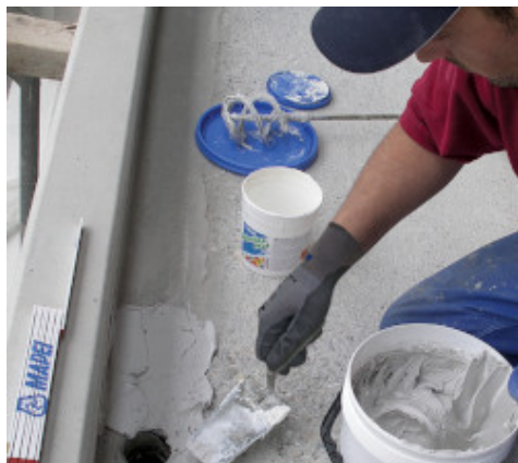
Stesura di Adesilex PG4 a cazzuola