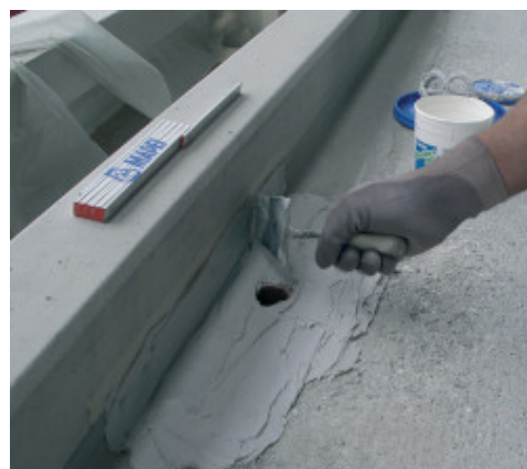
Copertura finale con Adesilex PG4