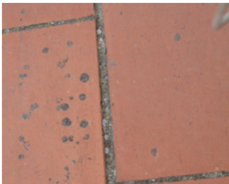
Pavimentazione esistente in cotto che necessita di preparazione prima della posa di Aquaflex Roof