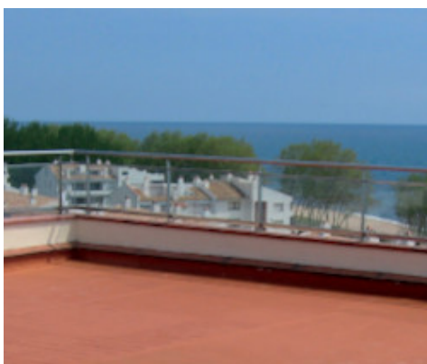
Lastrico solare impermeabilizzato con Aquaflex Roof