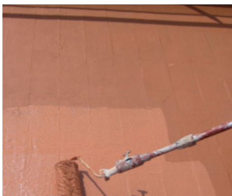
Applicazione di Aquaflex Roof con rullo a pelo lungo