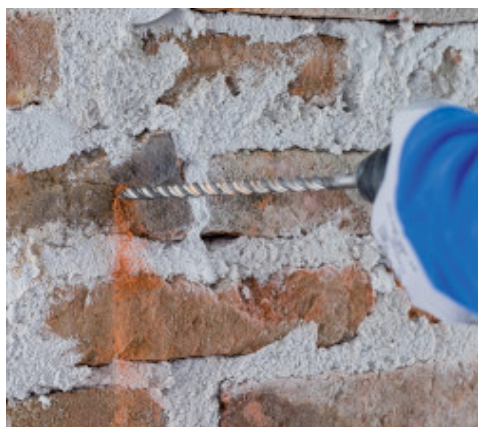
Realizzazione dei fori