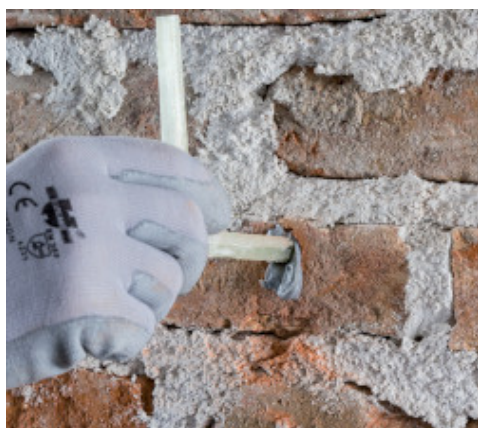
Posa di Mapenet EM Connector