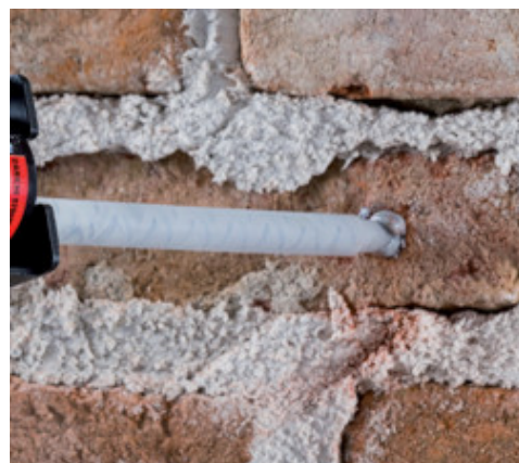
Applicazione di fissaggio chimico