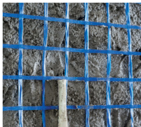
Posa di Mapenet EM