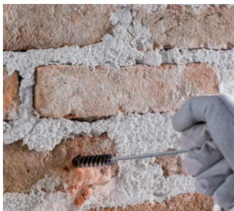
Asportazione delle polveri dai fori