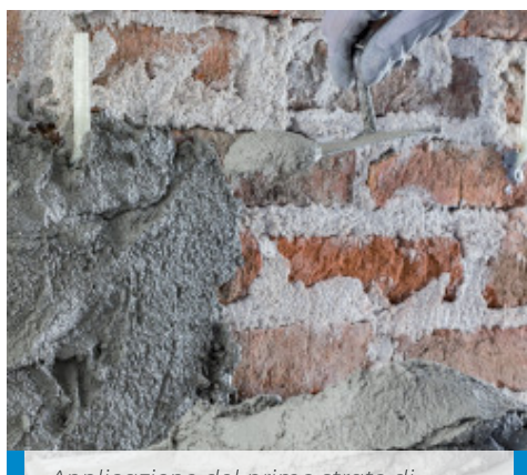
Applicazione del primo strato di MapeWall Intonaca & Rinforza