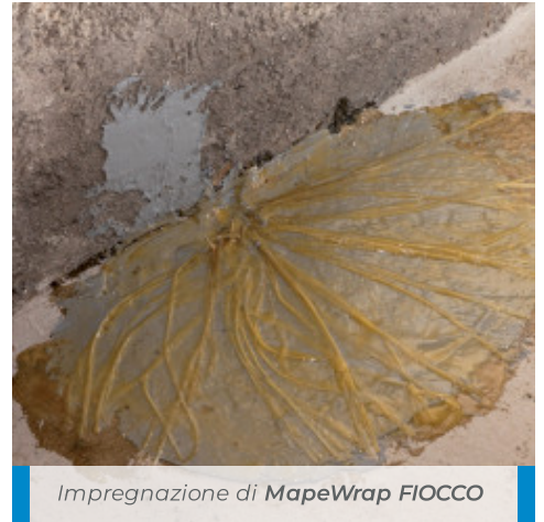
Impregnazione di MapeWrap FIOCCO