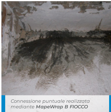
Connessione puntuale realizzata mediante MapeWrap B FIOCCO