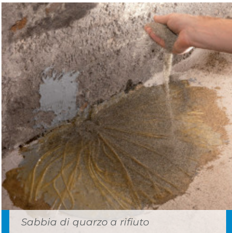
Sabbia di quarzo a rifiuto