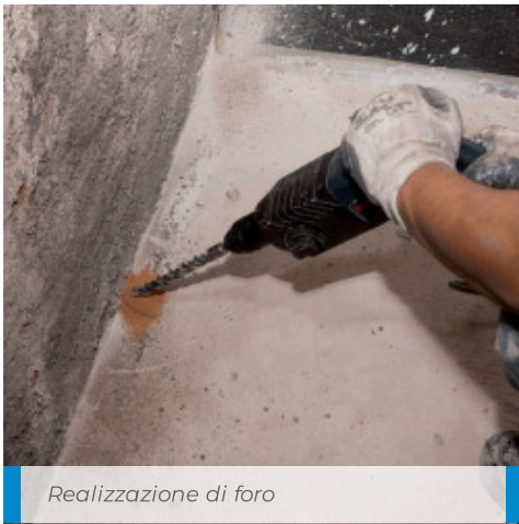
Realizzazione di foro