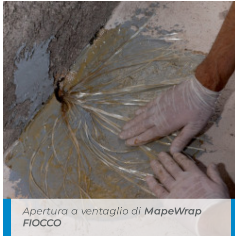
Apertura a ventaglio di MapeWrap FIOCCO