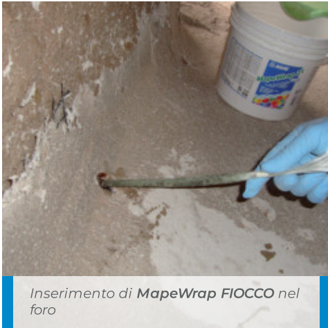
Inserimento di MapeWrap FIOCCO nel foro