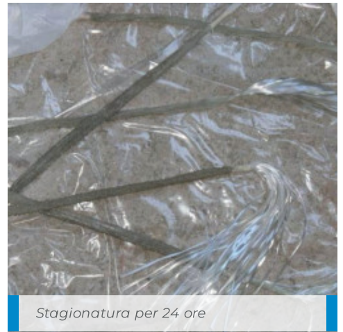
Stagionatura per 24 ore