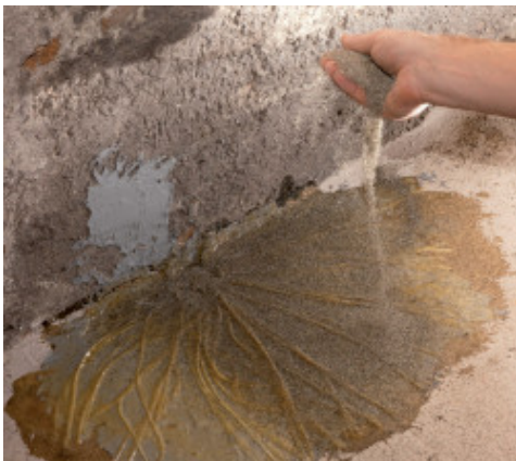
Sabbia di quarzo a rifiuto