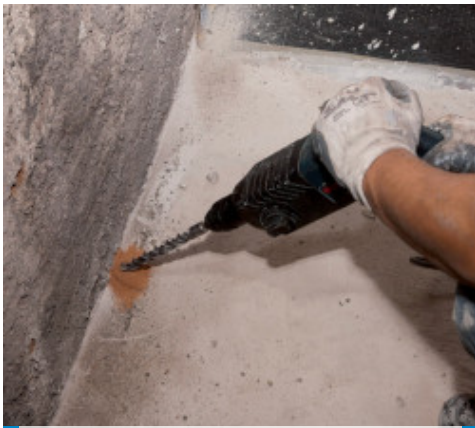
Realizzazione di foro