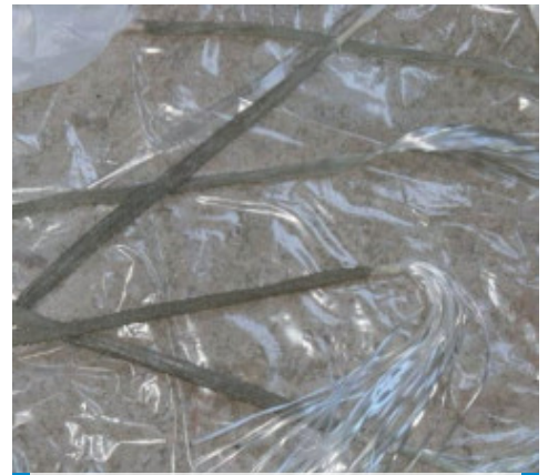
Stagionatura per 24 ore