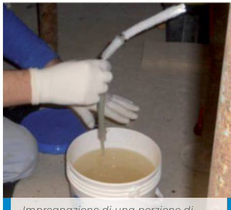
Impregnazione di una porzione di MapeWrap FIOCCO