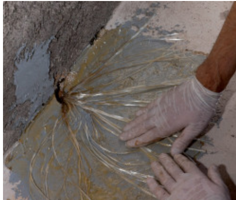
Apertura a ventaglio di MapeWrap FIOCCO