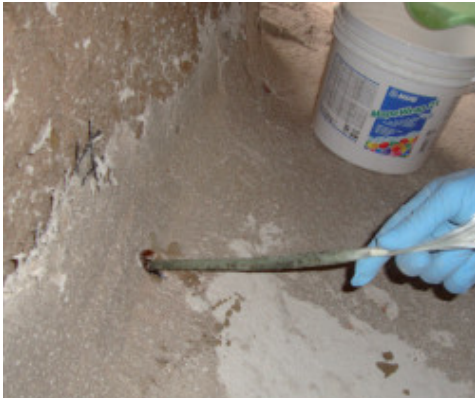
Inserimento di MapeWrap FIOCCO nel foro