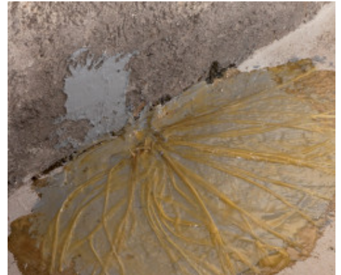
Impregnazione di MapeWrap FIOCCO