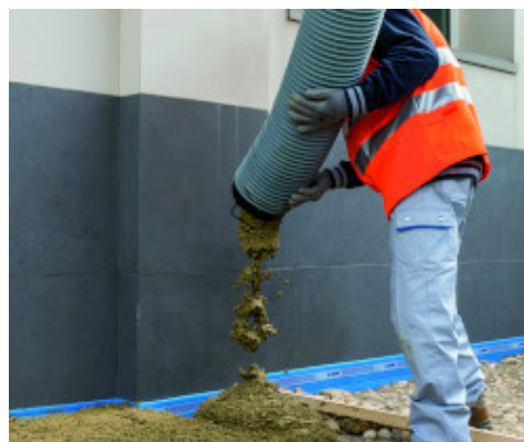
Scarico del calcestruzzo architettonico con Color Paving Admix