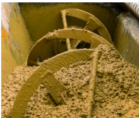
Confezionamento del calcestruzzo con Color Paving Admix