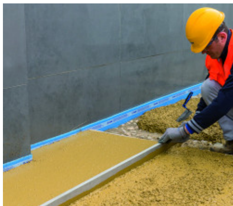
Staggiatura del calcestruzzo