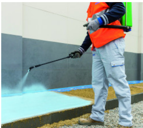
Applicazione di Mapewash PO