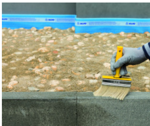
Protezione con Mapewash Protex di tutti i supporti

Evitare di avvicinarsi troppo con la lancia dell'idropulitrice o regolare la pressione di lavaggio per evitare che supporti non particolarmente duri possano danneggiarsi.