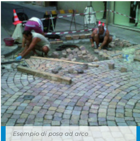
Esempio di posa ad arco

La stuccatura diventa pedonabile dopo 12-24 ore, mentre diventa carrabile già dopo 7 giorni a +20°C. In caso di temperature inferiori a +15°C i tempi di pedonabilità e carrabilità si allungano sensibilmente.