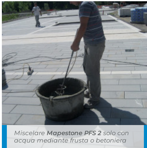
Miscelare Mapestone PFS 2 solo con acqua mediante frusta o betoniera