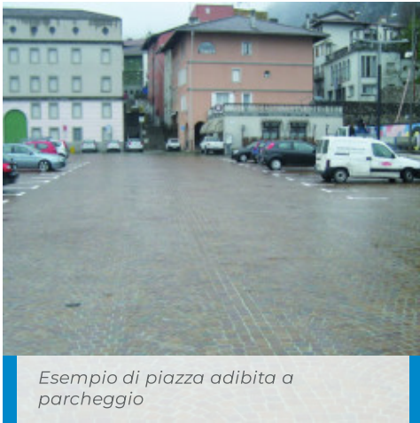
Esempio di piazza adibita a parcheggio