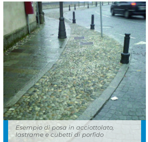
Esempio di posa in acciottolato, lastrame e cubetti di porfido