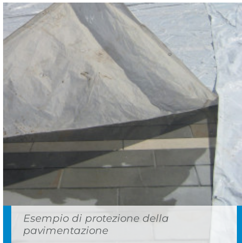
Esempio di protezione della pavimentazione