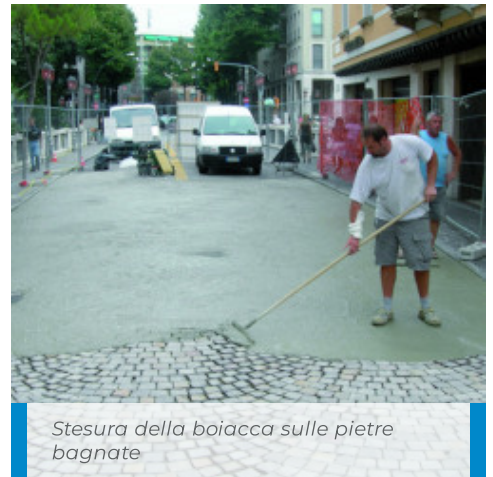
Stesura della boiaccia sulle pietre bagnate