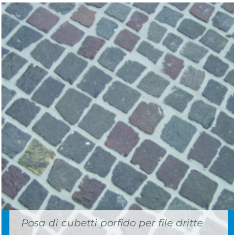
Posa di cubetti porfido per file dritte