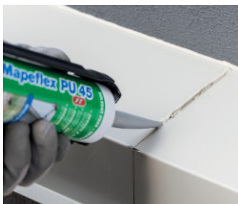
Sigillatura elastica di giunti di costruzione